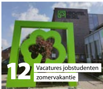
12 Vacatures jobstudenten zomervakantie