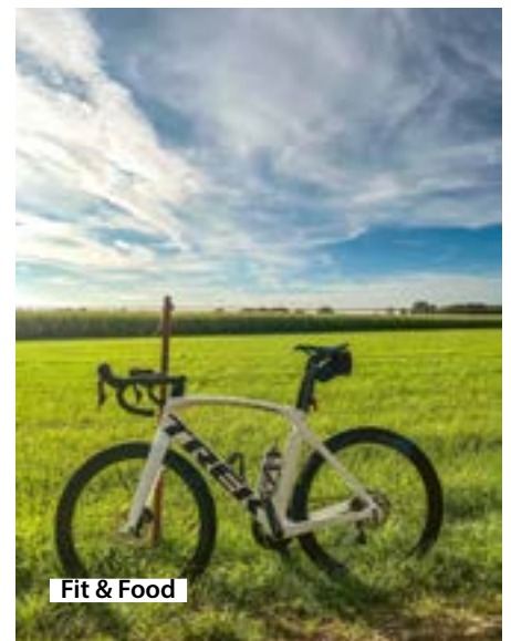
Fit & Food