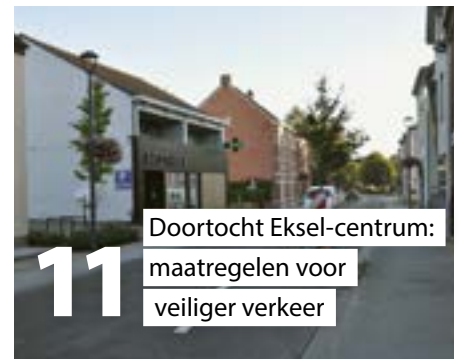
11 Doortocht Eksel-centrum: maatregelen voor veiliger verkeer