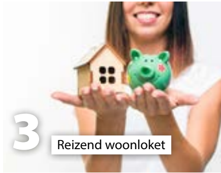
3 Reizend woonloket