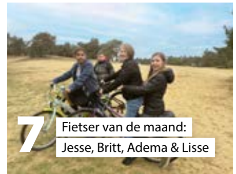
7 Fietser van de maand: Jesse, Britt, Adema & Lisse