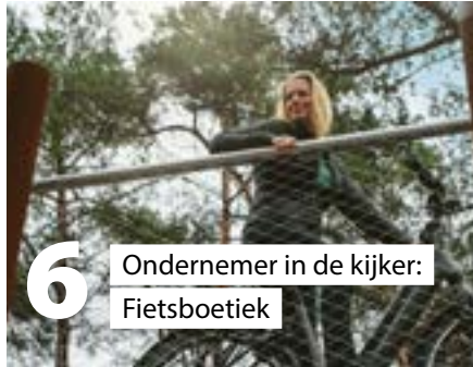
6 Ondernemer in de kijker: Fietsboetiek