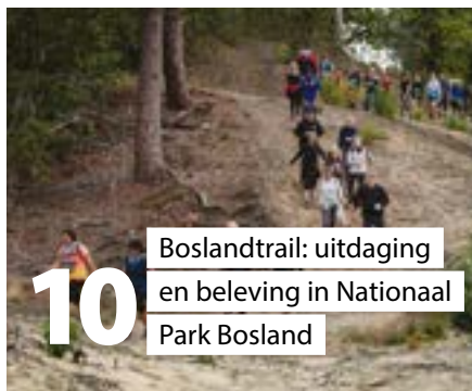
10 Boslandtrail: uitdaging en beleving in Nationaal Park Bosland