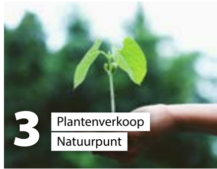
3 Plantenverkoop Natuurpunt