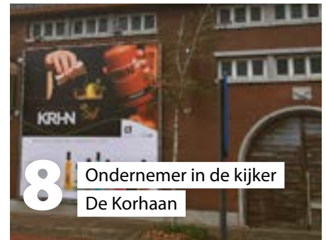
8 Ondernemer in de kijker De Korhaan