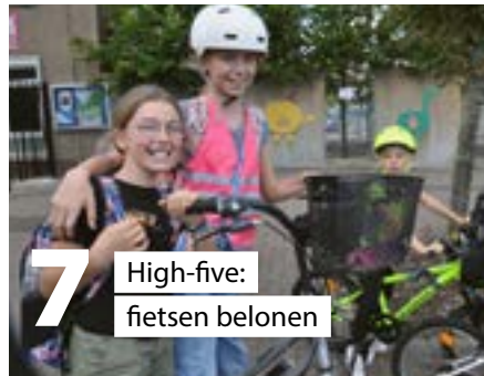
7 High-five: fietsen belonen