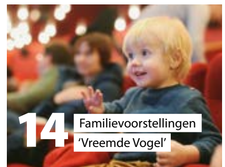
14 Familievoorstellingen 'Vreemde Vogel'