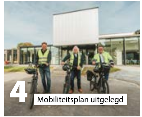
4 Mobiliteitsplan uitgelegd