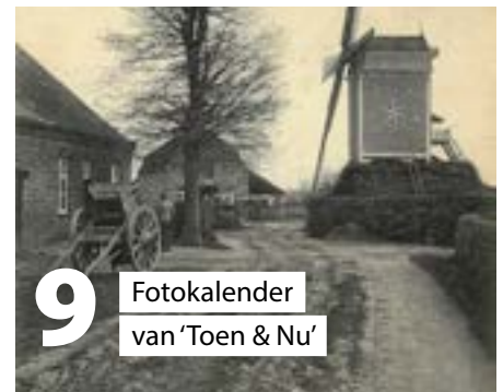
9 Fotokalender van 'Toen & Nu'