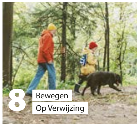
8 Bewegen Op Verwijzing