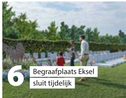
6 Begraafplaats Eksel sluit tijdelijk