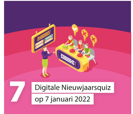
7 Digitale Nieuwjaarsquiz op 7 januari 2022