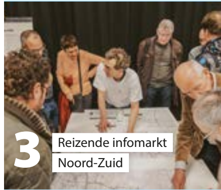
3 Reizende infomarkt Noord-Zuid