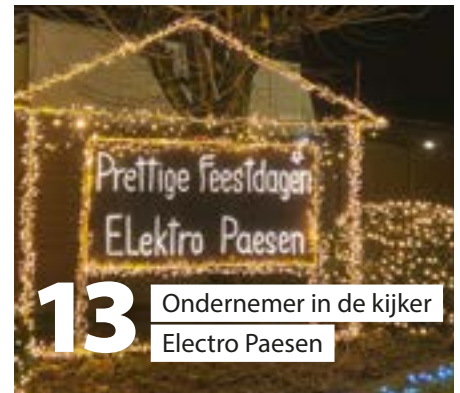
13 Ondernemer in de kijker Electro Paesen