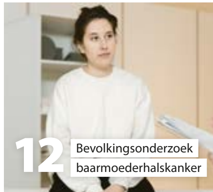
12 Bevolkingsonderzoek baarmoederhalskanker