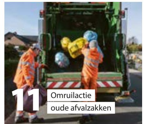
11 Omruilactie oude afvalzakken