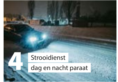
4 Strooidienst dag en nacht paraat