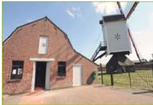
Het Molenhuisje - Windmolenstraat 3940 Hechtel-EKSEL